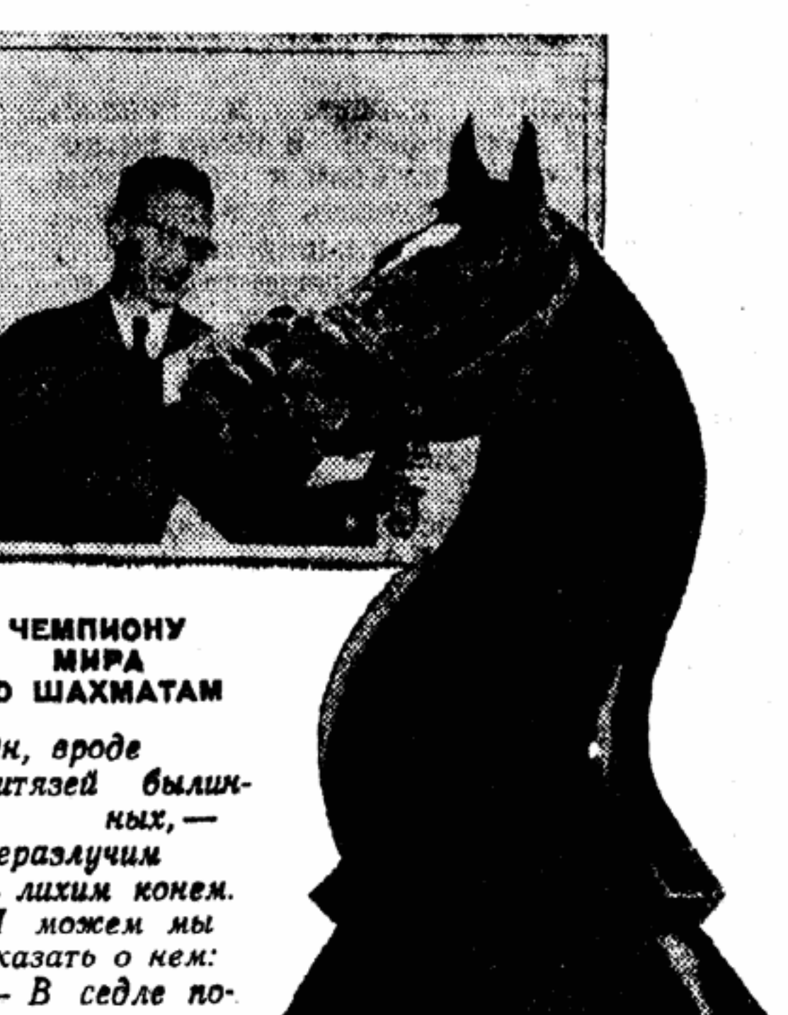
Фотомонтаж А. ЖИТОМИРСКОГО