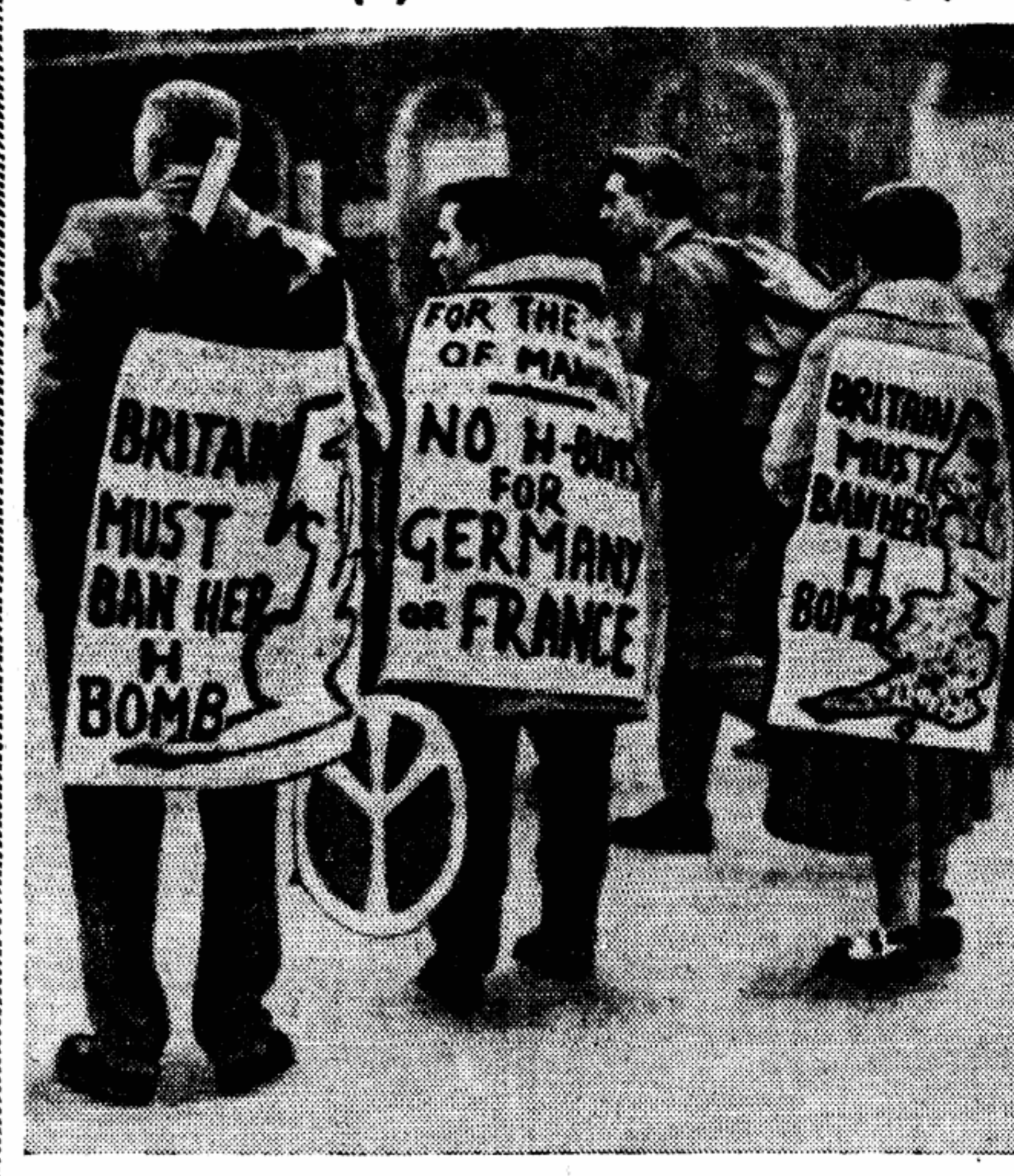
Английские сторонники мира борются против угрозы атомной войны и гоним ядерных вооружений. На снимке: трое молодых англичан с плакатами, на которых написано: «Британия должна объявить свою ядерную бомбу вне закона», «Никаких водородных бомб для Германии или Франции».