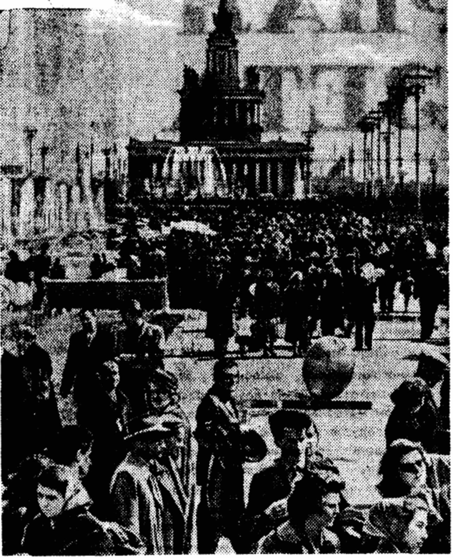
Всего на выставке 1958 года будет демонстрироваться более 600 различных сельскохозяйственных машин. Десятки тысяч энтузиастов со всей страны будут изучать на ВСХВ методы и приемы работы передовиков сельскохозяйственного производства с тем, чтобы еще лучше и быстрее осуществить разработанную Коммунистической партией программу дальнейшего подъема социалистического сельского хозяйства.

Значительные изменения претерпел раздел механизации. На территории бывшей «Усадьбы МТС» создана типовая РТС — ремонтно-техническая станция, рассчитанная на обслуживание 300—400 тракторов, 150 автомобилей и 200 различных сельскохозяйственных машин и орудий. На одной из открытых площадок демонстрируется техника, рекомендуемая для продажи колхозам. У каждой машины — табличка, на которой можно узнать адрес завод-поставщика, экономическую эффективность машины, ее стоимость.