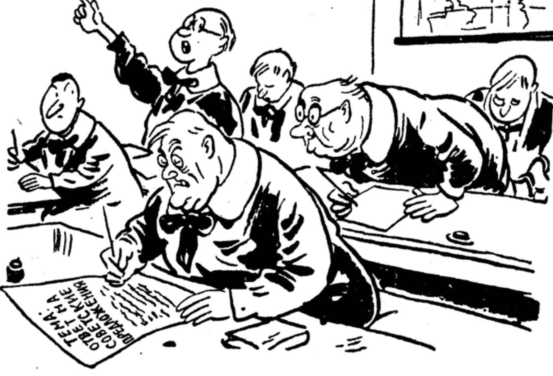
— Господин учитель! А Дзюли списывает... Рисунок худ. Камерини из итальянской газеты «Паззэ».

это не от хорошей жизни. Рядовые труженики нищают, в то время как прибыли итальянских и иностранных монополистов, обновившихся в стране, баснословно выросли. Общую картину можно обрисовать с помощью нескольких, так сказать, цифровых мазков. За период только с 1953 по 1956 год доходы итальянского отделения нефтяного концерна «Эссо-Стандард» выросли с 21 миллиона лир до 788, доходы электрического концерна «Адриатика» — с 2 095 до 4 012 миллионов, прибыли ФИАТ — с 9 575 до 14 055 миллионов лир. Монополисты потирают руки, грядущим хватаются за головы — как жить дальше? С 1948 по 1957 год цены на важнейшие продукты питания повысились следующим образом: хлеб — на 17 проц.,