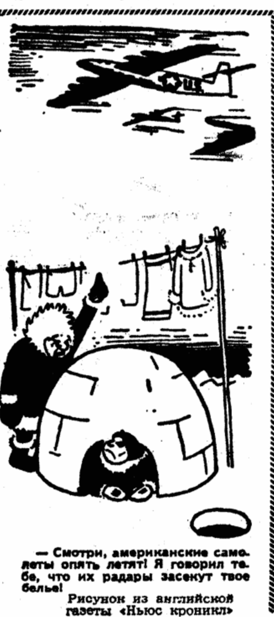
— Сматри, американские самолеты опять летят! Я говорю тебе, что их радари засекут твое белое!

Только одна подлинно интернациональная, подлинно революционная и героически борющаяся в нелегальных условиях коммунистическая партия Польши доносила до народа слова правды о Советском Союзе.